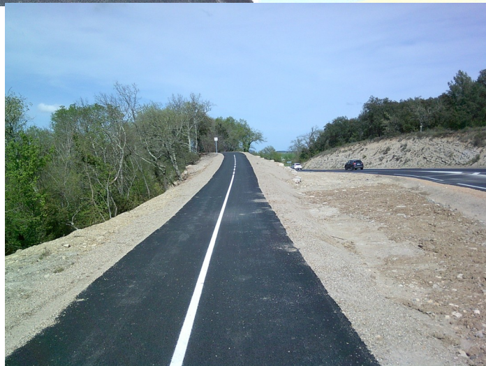
Route départementale D8 entre le village de Logrian et le Carrefour de la D 8 et D 35 entre direction de Sauve ou Quissac