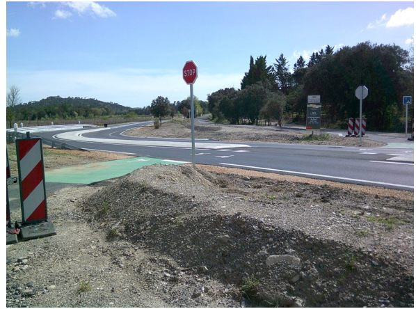
Route départementale D35 Anduze Quissac